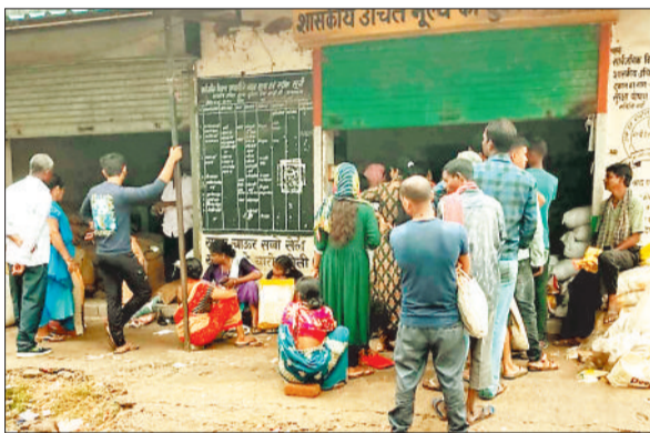
खाद्यान्न लेने कतार में खड़े हितग्राही।

खाद्य विभाग की पीडीएस दुकानों में खाद्यान्न उठाव के मामले को लेकर बोगस राशनकार्ड सहित कई ऐसी शिकायतें आ रही थी जिसमें महीनों से लोग राशनकार्ड से खाद्यान्न का उठाव नहीं कर रहे थे और ऐसे भी हितग्राहियों थे जो राशनकार्ड बनाने के बाद क्षेत्र को छोड़कर कहीं और चले गए हैं। इसके साथ ही कई हितग्राही मृत हो चुके हैं उसके बावजूद उनके राशनकार्ड पीडीएस दुकान के रिकार्ड में जीवित बताए जा रहे थे। ऐसी तमाम