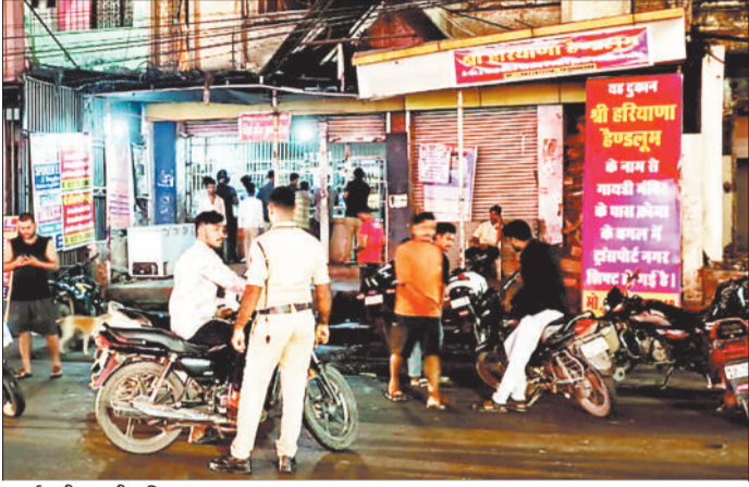
कार्यवाही करती पुलिस।