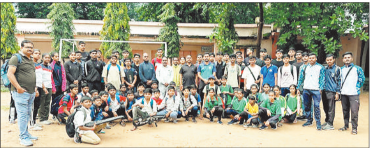
खिलाड़ियों के साथ टीम कोच व मैनेजर।

वर्ष ग्रामीण अंचलों में ब्लॉक स्तरीय खेलकूद प्रतियोगिता का आयोजन कराया जा रहा है जो कभी ब्लॉक मुख्यालय में हुआ करते थे। उनकी जगह अब दूरस्थ ग्रामीण अंचल में ब्लॉक स्तर की खेल प्रतियोगिताएं आयोजित की जा रही है। कोरबा ब्लॉक स्तरीय खेल प्रतियोगिता ग्राम गोद्धी में आयोजित की गई है। जिला शिक्षा अधिकारी ने दूरस्थ ग्रामीण अंचलों में खेल प्रतियोगिता आयोजित करने के लिए निर्देशित किया है ताकि ग्रामीण अंचलों के खिलाड़ियों को ब्लॉक मुख्यालय तक न आना पड़े। शनिवार को रायगढ़ जिले के लिए जिले की टीम को साडा कन्या हायर