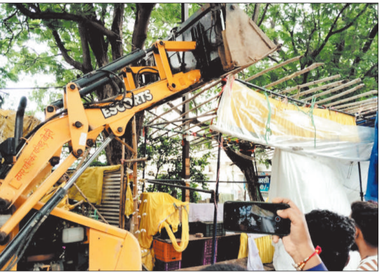
रायपुर रोड पर अतिक्रमण हटाने के लिए काम चल रहा है।