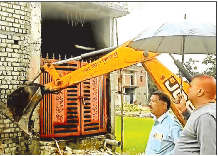
अवैध रूप से बनाए गए मकान को दहाता निगम का बुलडोजर।