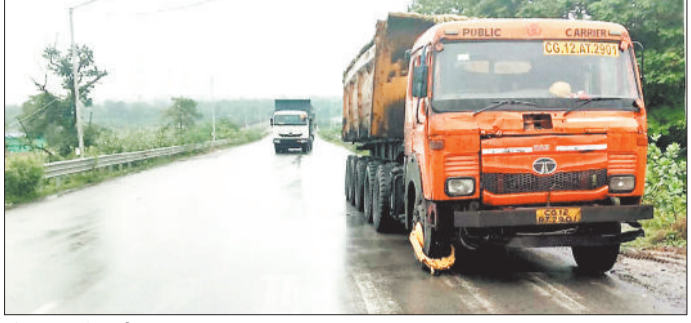
नो पार्किंग में खड़ी वाहन।