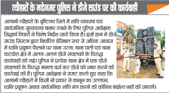
तयहारों के नदरेनगर पुलिस ने डीजे साउंड पर की कार्यवाही