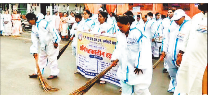
सड़कों की सफाई करते स्वास्थ्य कार्यकर्ता।

छत्तीसगढ़ प्रदेश राष्ट्रीय स्वास्थ्य मिशन कर्मचारी संघ की 10 स्त्रीय मांगों को लेकर शुरू हुई अनिश्चितकालीन हड़ताल कोरबा जिले में पांचवें दिन भी जारी रही। अपनी मांगों के समर्थन में स्वास्थ्य कर्मचारियों ने सरकार का ध्यान आकर्षित करने के लिए अनेखा प्रदर्शन किया। इस दौरान उन्होंने पीपीई किट पहनकर, हाथों में झाड़ू लेकर सड़कों की सफाई की और घरना स्थल के आसपास दुकानों व राहगीरों से भीख मांगकर अपनी मांगों को रेखांकित किया। एनएचएम कर्मचारियों की प्रमुख मांगों में नियमितकरण, वेतन विसंगतियों का समाधान, और स्थायी कर्मचारियों के समान सुविधाएं प्रदान करना शामिल है। कर्मचारियों का आरोप लगाते हुए