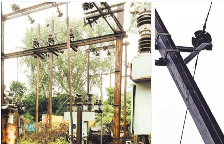
द्रासफॉर्म और इंसुलेटर का किया गया मरम्मत कार्य।